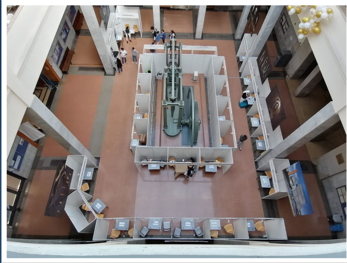
Feria de Voluntariado Universitario "Volunfair "